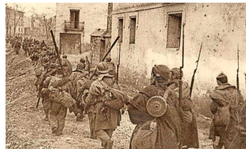
Een beeld uit de Spaanse Burgeroorlog die duurde van '36 tot '39. Hier nemen (vermoedelijk) regeringstroepen een stad in. De Internationale Brigades hielpen in de strijd tegen de fascistische Franco. ARCHIEFFOTO

Ongeveer dertig vrouwen, met kinderen aan hun zijde lagen daar gefusilleerd. Hun mannen en vaders hadden aan de zijde der rechtvaardigheid gestreden